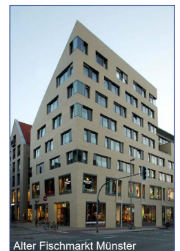
Alter Fischmarkt Münster