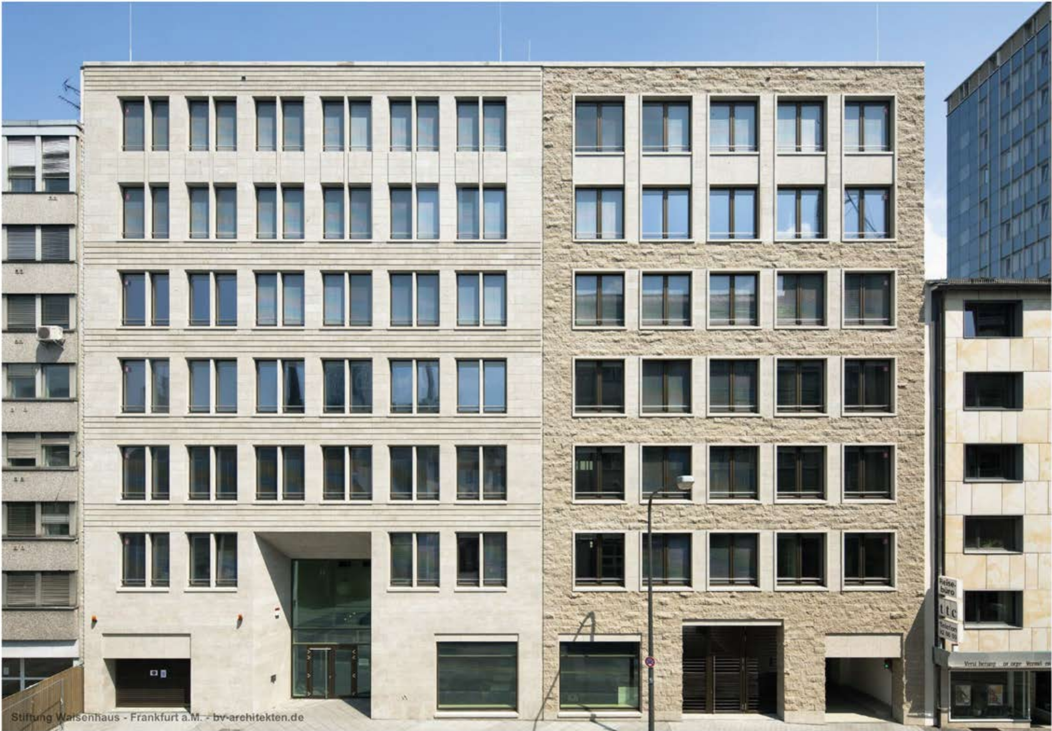
Stiftung Waisenhaus - Frankfurt a.M. - bv-architekten.de