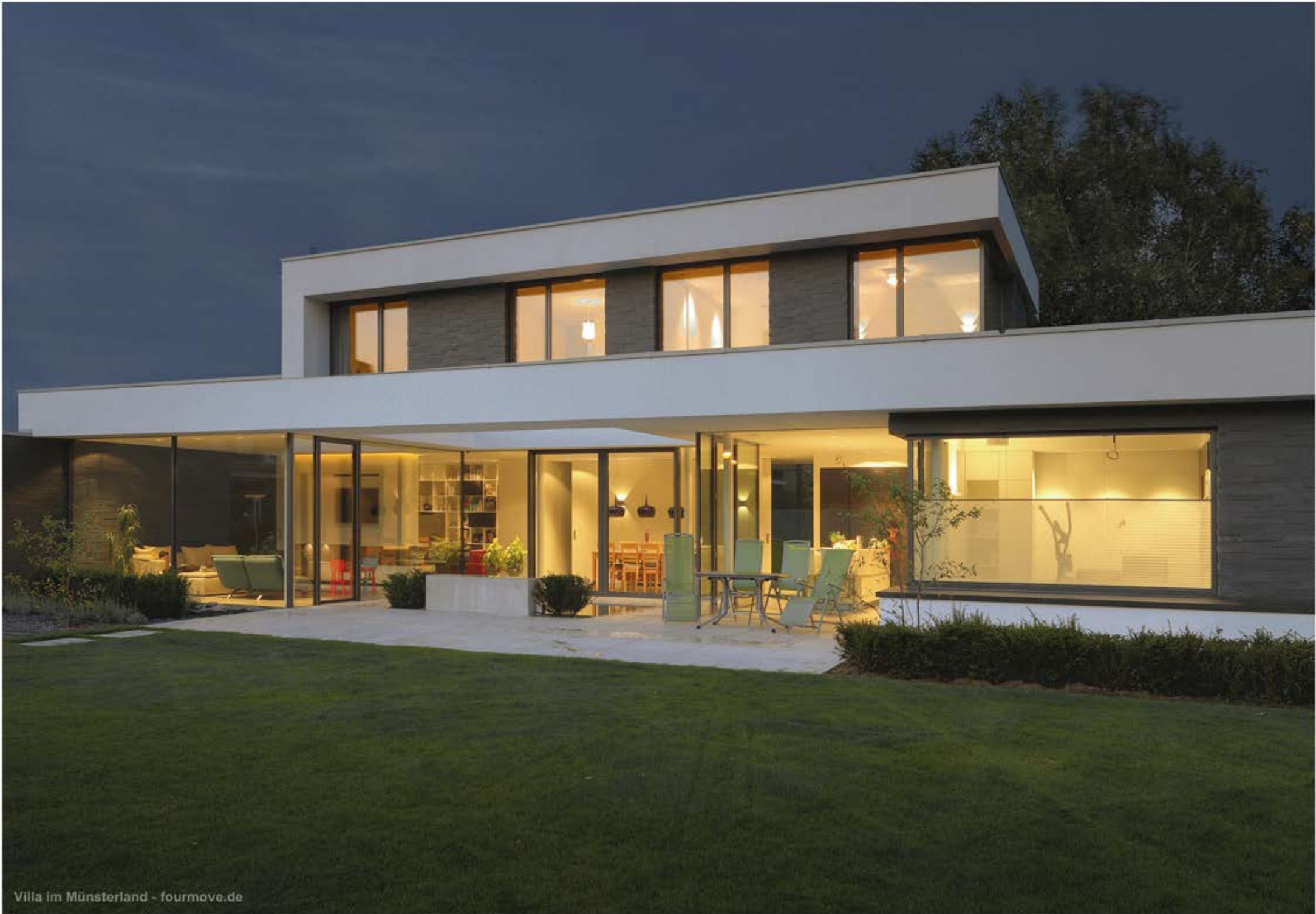
Villa im Münsterland - fourmove.de